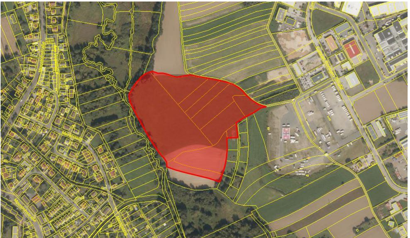
Geltungsbereich, Stadt Weiden i.d.OPf.

Die Vorhabenfläche liegt in Weiden i.d.OPf. westlich des Gewerbegebietes „Neustädter Straße“, nördlich des Stadtteils „Rehbühl“ und schließt direkt westlich an den neuen Volksfestplatz an. Der Geltungsbereich umfasst zehn Flurstücke, die bisher landwirtschaftlich als Grünland oder Ackerfläche genutzt werden. In einem Abstand von 10 – 15 m fließt der Sauerbach westlich entlang der Grundstücksgrenze, der in diesem Bereich in die Gewässerstrukturkartierung (Gewässer 3. Ordnung) als gering verändert aufgenommen wurde. Gesäumt ist der Bach mit Gewässer-Begleitgehölzen. Nördlich schließen an den Geltungsbereich weitere landwirtschaftlich genutzte Flächen an.